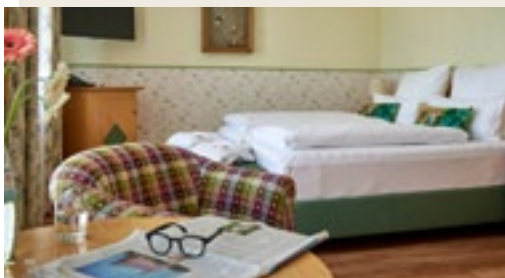
Gemütlich schlafen und wohnen

Sie haben Fragen oder besondere Wünsche? Rufen Sie uns gerne an!