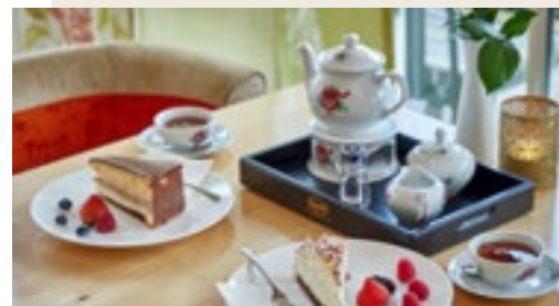
Ostfriesische Teezeit mit Vier Jahreszeiten-Torte