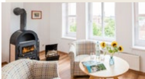
Ein echtes Highlight: eigener Kamin in der Suite