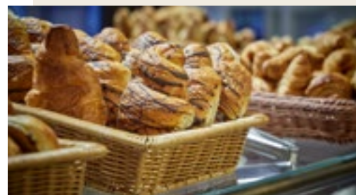
Echte Handwerkskunst und täglich frisch